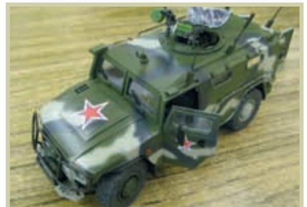
DE ONDERSTE BEELDEN: IAN'S MENG KIT (MET CAMO DUS).