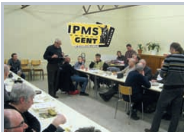
◀ HET NIEUWE LOKAAL MET HET LOGO REEDS OP DE MUUR (GRAPJE VAN DE PHOTOSHOPPER).