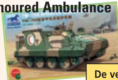
FILIP'S YW-750 MAAR DAN IN EEN ANDERE VERPAKKING.