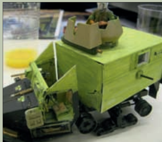
▶ WILLY'S 'FRUITIGE KLEURTJES HALF-TRACK'.