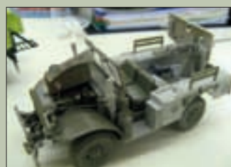
▲ M6 DODGE MET 37MM KANON.