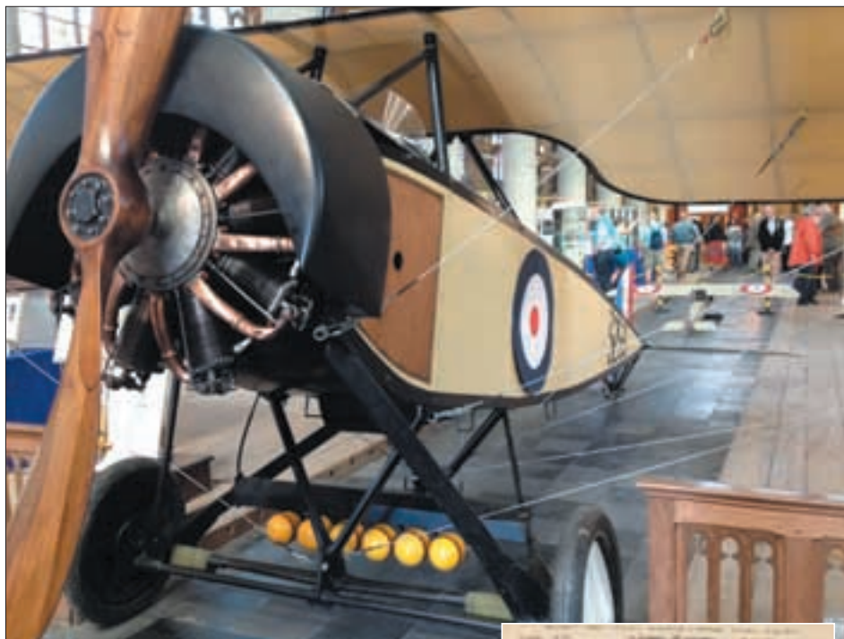
▲ HIERBOVEN DE REPLICA VAN DE MORANE- SAULNIER L VAN REGINALD WARNEFORD

Op 7 juni is er nog een herdenkingsdag met een vol programma. Dat is ook de dag tot wanneer de tentoonstelling loopt.