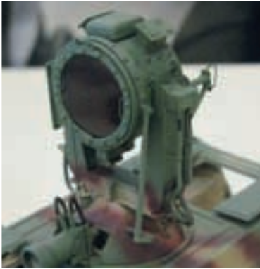
Erik Lebon toonde ons zijn 1/35 SWS van Italeri. Deze werd volledig met een infra-rood zoeklicht (een "Uhu" versie), scratch gebouwd. Dit laatste gebaseerd op "Verlinden".