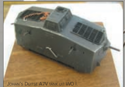
JOHAN'S DUITSE A7V TANK UIT WO I.