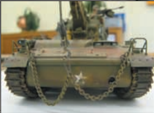
▲ WILLY'S TOWING TANK.