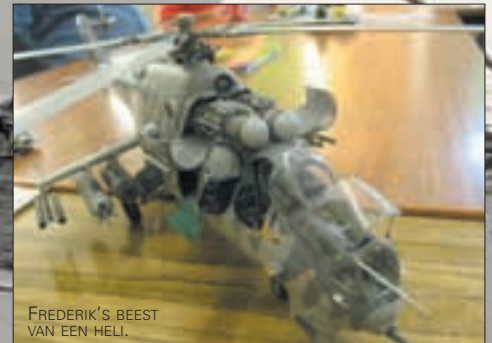
FREDERIK'S BEEST VAN EEN HELI.