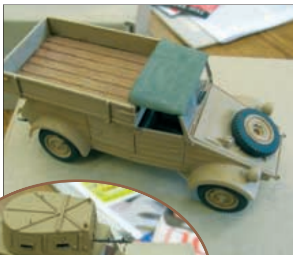
▲ KÜBELWAGEN TYPE 825.

Het tweede model betrof een Type 825 Kübelwagen, een soort van kamionette, zoals die tegen het einde van WO II en ook na de oorlog nog werd gebouwd. Het typenummer behoort tot de Porsche nomenclatuur. Na de oorlog werd dit het vereenvoudigde type 27: geen spiegels, geen richtingaanwijzers, geen claxon, maar één ruitenwischer, ... Besparingen dus. Willy vond een zeildoek bij Italeri, dat wonderwel op zijn Tamiyamodel paste. Van deze Kübels zijn weinig foto's beschikbaar.