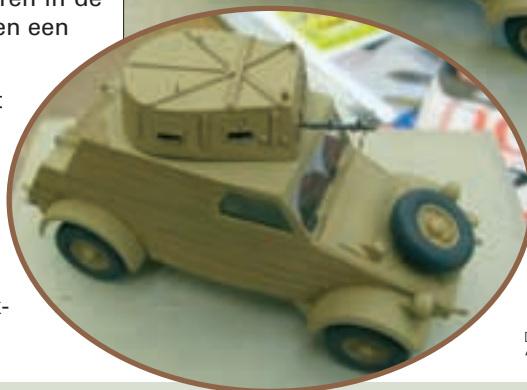
◀ DE KÜBELWAGEN MET 'TOREN'-OPBOUW.