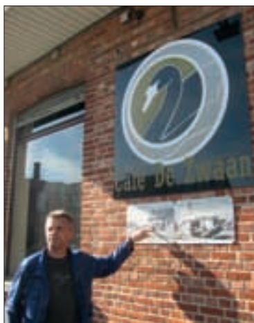
◀ ONZE GIDS AAN CAFÉ DE ZWAAN MET DE HULDEFOTO'S.

Zo'n tank werd soms een echte 'landmark' maar moest uiteindelijk toch verdwijnen.