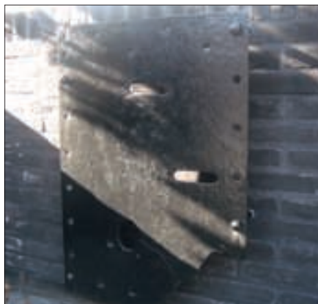
▼ DE STALEN PLAAT AFKOMSTIG VAN DE ORIGINELE TANK.