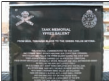
▲ HET TANK MEMORIAL MONUMENT ALS EERBEToon VOOR DE GESNEUVELDEN. GEHEEL BOVEN: DE GUINEMER ZUIL OP HET DORPSPLEINTJE.