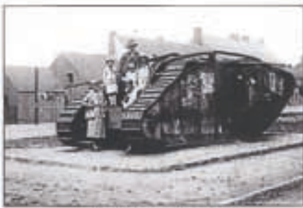
Tank MK IV © 28 Damon - Poelkapelle