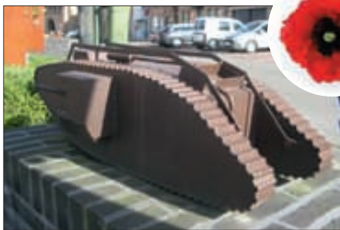
▲ EEN METALEN MAQUETTE VAN DE TANK NABIJ HET MONUMENT OP DE MARKT.