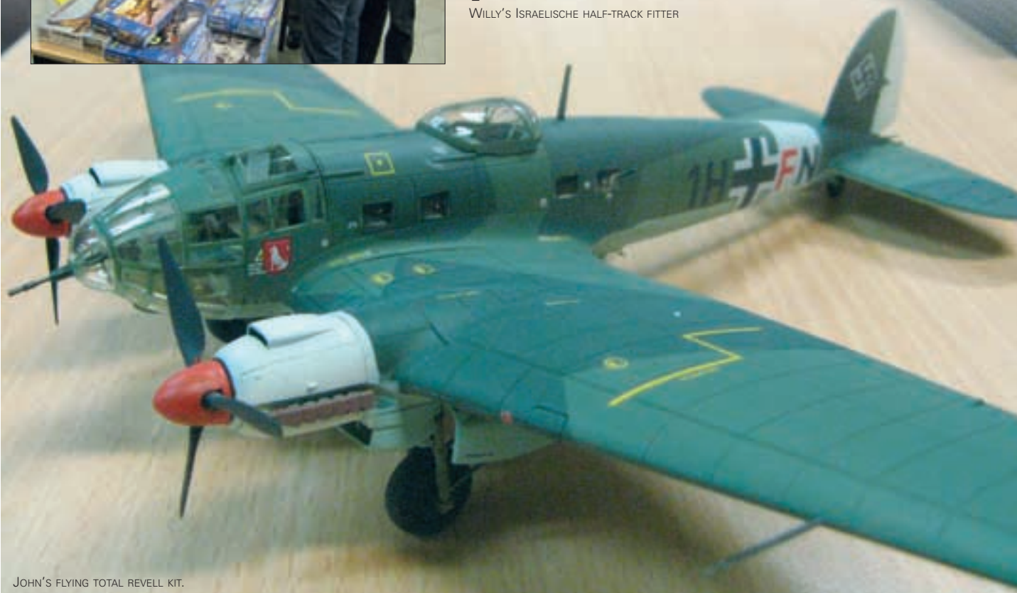
JOHN'S FLYING TOTAL REVELL KIT.