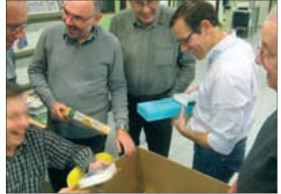
▲ KITS EN MODELBOUWERS = ALWAYS FUN (BOVEN VAN LINKS NAAR RECHTS).