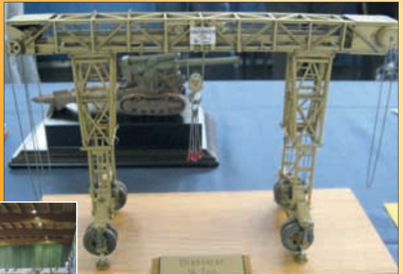
▲ FREDDY'S STRABOKRAN KRAAN KAAPTE DE IPMS BEST OF SHOW-TROFEE WEG. KNAP STAALTJE VAN SCRATCH BULDEN.