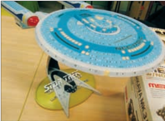
▲ U.S.S. ENTERPRISE, HEBBEDING VAN TREKKIE JEROEN.

▶ JOHAN'S LIMITED EDITION DIE-CAST MODEL VAN OXFORD MODELS, MET RECLAME VOOR MODELBOUWERS - AIRFIX & HUMBROL. ENGELSE HUMOR?