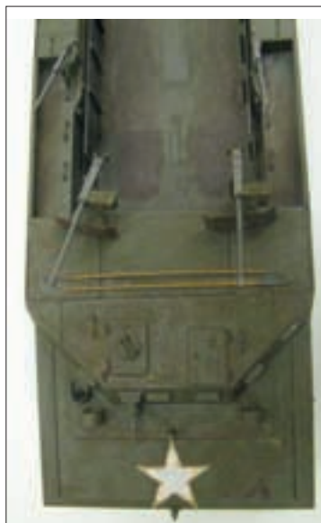
▼ EIGENLIJK WAREN HET VOORAL DE BRITTEN DIE DE NAAM BUFFALO GEBRUIKTEN. DIT IS UITERAARD DE US VERSIE.