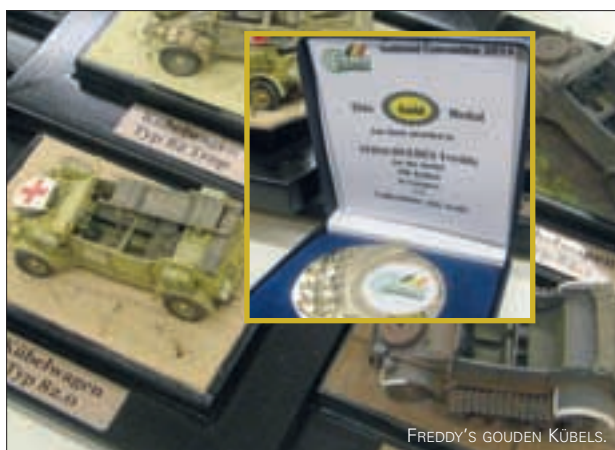
FREDDY'S GOUDEN KÜBELS.