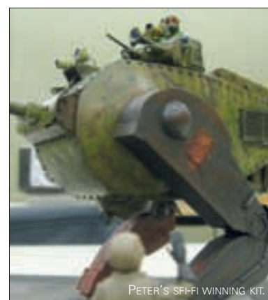
PETER'S SCI-FI WINNING KIT.