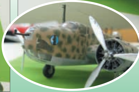
◀ ▲ LINKS DE CANT, HIERNAAST EN BOVEN DE FIAT.