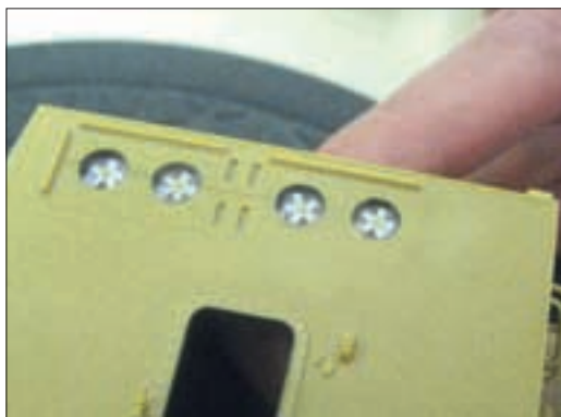
◀ LINKS EN LINKS ONDER: VENTILATORS EN RESP. TRACKS VAN DE YW-750.