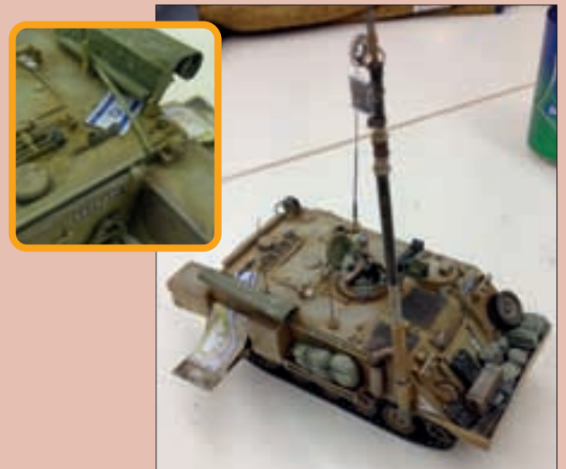
▲ WILLY MAAKTE IN DECEMBER OOK INDRUK MET EEN ISRAËLISCHE GEMODIFIEERDE M113.