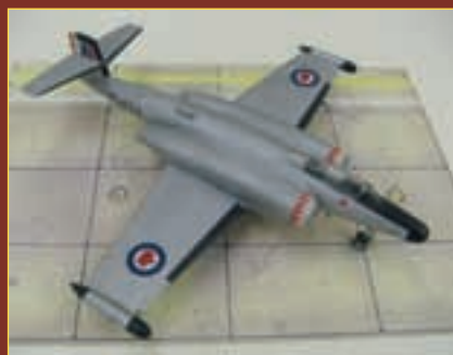
▲ FRANKLIN BRACHT ONS CANADESE VERSIES: EEN LOCKHEED T-33 (IN CANADA OOK CT-133 'SILVER STAR' GENOEMD) EN RECHTS EEN AVRO CF100 (CANUCK).