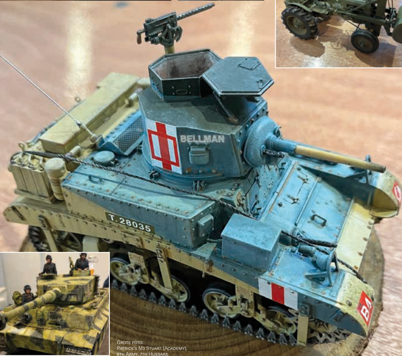
GROTE FOTO: PATRICK'S M3 STUART (ACADEMY), 8TH ARMY, 7TH HUSSARS.